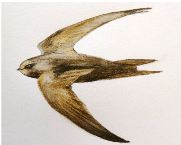
Dessin : Lise Laclavetine

En ce moment vous pouvez le voir chaque jour planer dans le ciel montreuillois. Le martinet noir est un migrateur qui arrive mi mai dans nos contrées, annonçant ainsi le printemps, et qui repart en août vers l'Afrique. Il est souvent confondu avec l'hirondelle mais il est bien plus citadin qu'elle et ses ailes sont très nettement en forme de faucille. Autre différence majeure, il ne se pose jamais sauf pour la couvaison. Sa morphologie ne lui permet d'ailleurs pas vraiment de se percher ou de marcher car ses ailes sont plus longues que son corps et ses pattes sont toutes petites. Ainsi il peut rester jusqu'à dix mois d'affilé dans les airs ! Il se nourrit du plancton aérien (composé d'insectes volants) ce qui fait de lui un pur carnivore. Même les éléments de son nid sont recueillis en vol qu'il fixe avec sa salive dans les cavités étroites de bâtiments. Il s'accouple en vol avec un partenaire qu'il gardera toute sa vie si tout