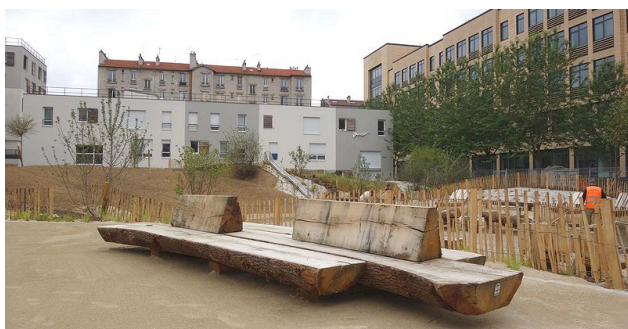
Photo prise le 9 juin 2020, lors des travaux de fin de chantier

Le nouveau square Virginia Woolf dans le Bas Montreuil est ouvert au public depuis le 8 août à 8 h. Il accueille un parcours circulaire, des buttes, des jeux rustiques en bois et un jardin partagé géré par l'association Gens du Jardin.