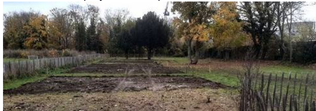
Mi-nov 2021 : débroussaillage, préparations des sols, délimitation des emplacements des arbres