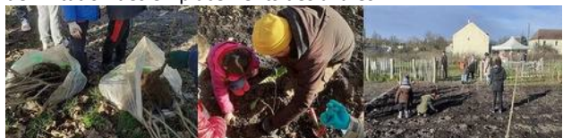
Plantations participatives avec les habitants et les enfants des écoles - dec 2021

Des habitants ont pu découvrir en musique le 16 octobre dernier le projet de Pépinière du parc des Hauteurs , un projet expérimental porté par Est Ensemble qui a missionné le collectif Anima. « La pépinière des Hauteurs » s'installe dès cet automne avec le concours des jardiniers municipaux dans le parc-jardin entre les rues de la Montagne Pierreuse et René Vautier (ZAC Boissière Acacia). Après les travaux de préparation du sol fin novembre, les habitants et leurs enfants étaient conviés le 11 décembre 2021 à planter les premiers plants avec le Collectif Anima. Les plantations se poursuivent avec la participation des élèves des écoles voisines de Nanteuil et Odru. Les jardiniers communaux termineront la plantation.