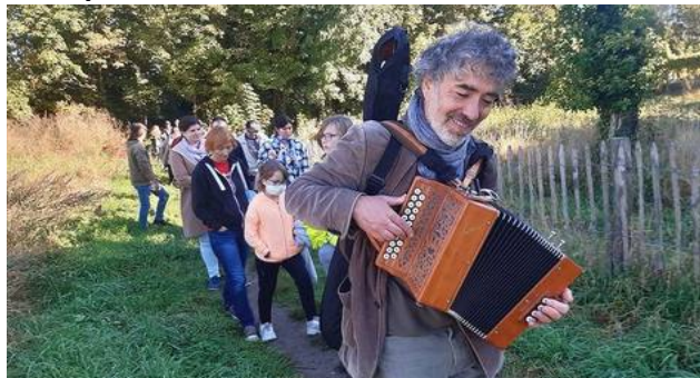
Présentation du projet en musique le 16 oct 2021