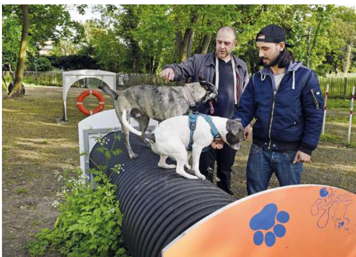
Les chiens Aku et Sam s'amuse sur le parcours sportif dédié.