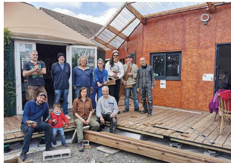
Terrasse et accès pour les personnes handicapées ont été créés.

Restaurant ouvert mercredi et jeudi midi, et midi et soir le vendredi. Dimanche midi, déjeuner assuré par les bénévoles. Menu : 12 € (enfants, 6 €). Facebook : Café associatif Le Fait-tout ; boissierecafeassociatif@gmail.com