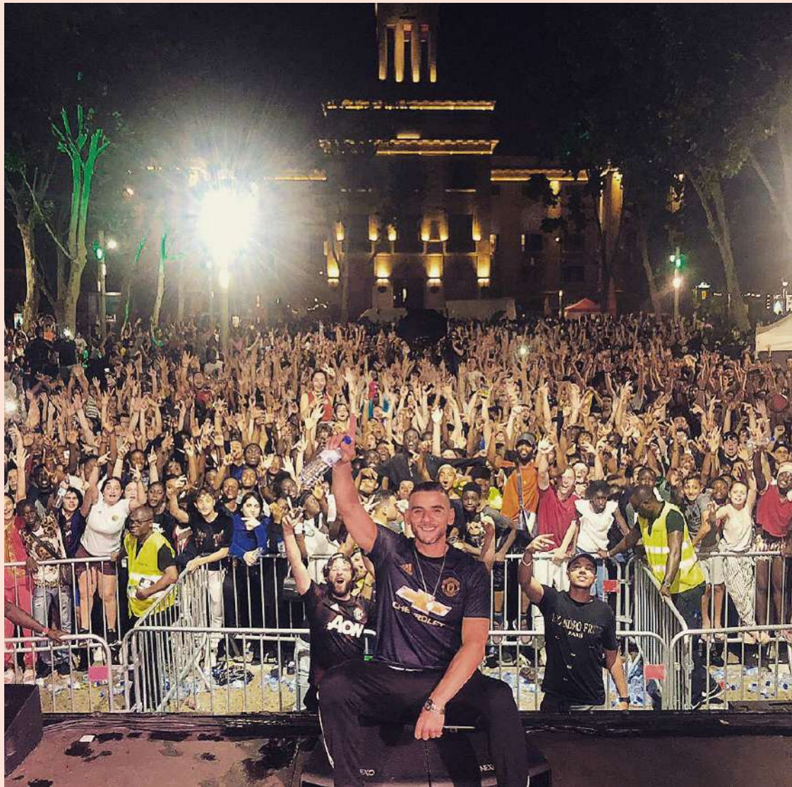
Lors de la première édition de Laisse crâner, Fianso avait rempli la place Jean-Jaurès.