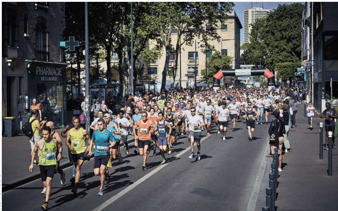
Avenue Walwein, la première ligne droite de la course. Au fond, la mairie et la ligne de départ.

Seulement trois éditions et déjà incontournable. Depuis qu'elle a été créée, en 2019, la Foulée montreuilloise est devenue le rendez-vous à ne pas manquer pour les Montreuillois et les amateurs de courses à pied solidaires. Dimanche 14 mai, elle s'élancera pour la troisième fois dans les rues de la ville, sans déroger à son credo : elle s'adresse à tous les publics, sans exception, que l'on soit valide ou en situation de handicap. Lors de la première édition, alors même que les rues de Montreuil n'avaient jamais été le théâtre d'une course pédestre, l'épreuve avait attiré plus de 1 000 participants. L'an passé, après un hiatus de deux ans dû à la crise du Covid-19, 1 300 coureurs avaient fait le déplacement. En 2023, selon les dernières estimations, ils devraient être environ 1 700 sur la ligne de départ. À mesure que les années passent, la Foulée gagne ainsi en popularité, et l'on ne peut que s'en féliciter. Coorganisée par la Ville et l'association À petits pas pour Lina (APPL, spécialisée dans l'accompagnement des