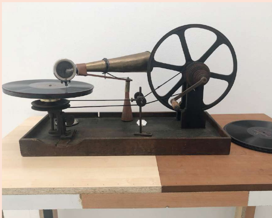
Au Centre Tignous, vous pourrez admirer un phonographe, ancêtre de l'électrophone.

« Notre approche est à la fois artistique et documentaire. Nous montrons plusieurs