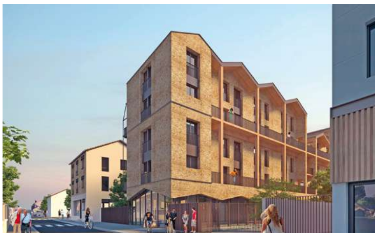
Voici à quoi ressemblera la résidence Les Sentes d'Ulysse.

Un T2 neuf de 45 mètres carrés à moins de 190 000 € ? Un T3 à partir de 250 000 € ? C'est ce que propose RATP-Habitat. Des prix « plancher », environ 30 % moins élevés que le marché. La filiale immobilière sociale de la RATP lance la commercialisation d'une résidence, rue Édouard-Branly, à la Boissière. Baptisée Les Sentes d'Ulysse, elle propose trente-trois appartements, du T2 au T4 en duplex, à deux pas de la future station de métro La Dhuis. Les logements sont de haute qualité environnementale, labellisés et fidèles aux recommandations de la charte montreuilloise pour la construction d'une ville rési-