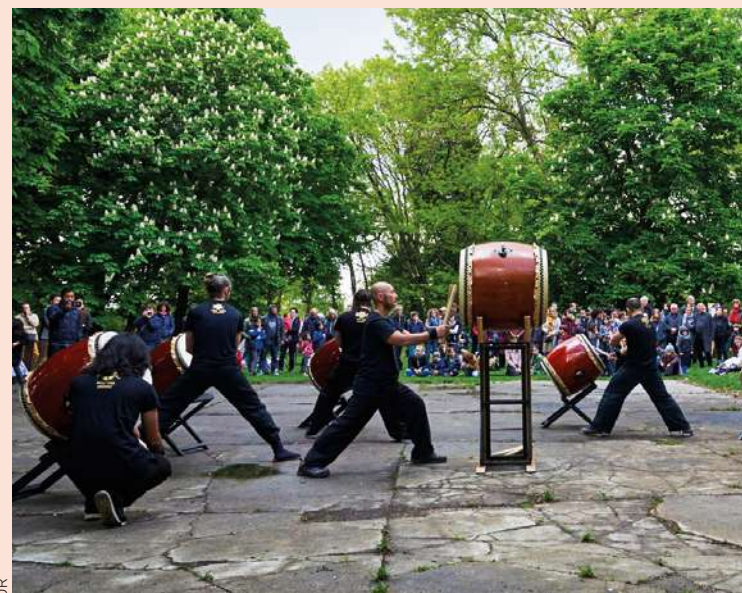
Le 14 mai, l'association Moment Lab vous convie à un matsuri.

Habiter au pied du parc des Beaumonts peut donner des idées singulières. Comme celle d'organiser un festival japonais dans cet accueillant écrin de verdure. Le 14 mai, l'association culturelle Moment Lab, fondée par deux artistes de la petite rue des Charmes, convie les Montreuillois à un matsuri. Un matsuri est une fête populaire japonaise qui se tient dans les villes et villages avec musique, danse, folklore, jeux... Ces rendez-vous traditionnels se sont multipliés en France ces dernières