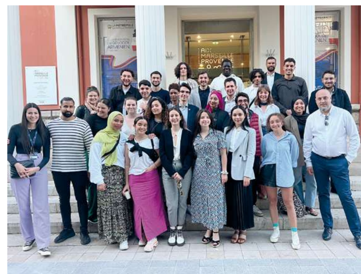
Le collectif des Maux aux mots de la République s'est rendu à Marseille pour visiter les instances citoyennes.

de fonctionnement. « C'était une belle opportunité ! J'ai été touchée par ces rencontres. Nous avons un gros travail de synthèse à réaliser », résume-t-elle. Si les contours restent à définir, le comité Jeunes sera une instance consultative. « Il permettra aux jeunes d'ajouter leur pierre à l'édifice. D'être force de propositions, de présenter des projets et de rencontrer les élus de la ville », ajoute Amir Rouibi, responsable du projet. ■ El hadji Coly