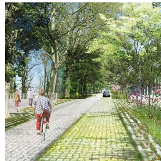
Un tronçon témoin de la future voie.