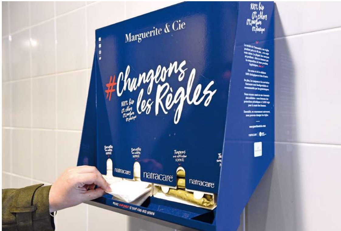
Retrouvez la carte des distributeurs de produits périodiques gratuits sur montreuil.fr

À Montreuil, 15 distributeurs de produits périodiques gratuits (tampons et serviettes hygiéniques) sont installés dans les structures municipales, les gymnases mais aussi, depuis peu, auprès des associations partenaires. Les premiers distributeurs ont été inaugurés dès le 8 mars 2021, faisant de Montreuil une ville pionnière. Vingt-cinq agents ont aussi été formés à la diffusion d'informations sur l'hygiène menstruelle. Ces initiatives, portées par le Centre communal d'action sociale (CCAS) avec la participation de la mutuelle municipale Solimut, ont pour but de rendre inconditionnellement accessibles ces produits de première nécessité à toutes les femmes. Donner accès aux produits périodiques permet en effet non seulement aux femmes et aux filles d'étudier, de travailler et de faire du sport sans être freinées dans leurs activités lorsqu'elles ont leurs règles,