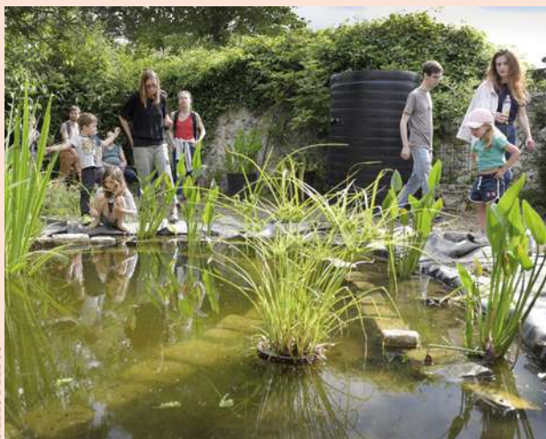
Sur les traces des Murs à pêches de Montreuil.

• Lékri Dézados à la bibliothèque Robert-Desnos LE club lecture pour les 10-17 ans. 15h, 14, bd Rouget-de-Lisle, entrée libre.