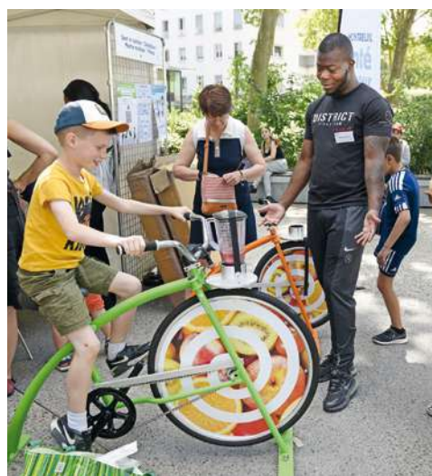
Des animations pour tous les âges.

Échanger avec des professionnels, s'informer sur des pathologies, se faire dépister, apprendre les gestes de premiers secours... Les raisons sont nombreuses de se rendre au nouveau forum santé, qui se tiendra le 24 mai sur la place de la mairie. Sous la trentaine de barnums, médecins, infirmières, psychologues, sages-femmes, diététiciennes, agents de prévention... de l'hôpital André-Grégoire, des centres municipaux de santé, des PMI, du département ou encore des membres d'associations accueilleront le public. Il sera question de l'alimentation, du sommeil, de la surexposition aux écrans, de la santé des seniors (Alzheimer, Parkinson),