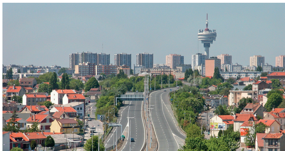
L'autoroute A 186 divise la ville en deux parties depuis les années 1970.

Elle en a connu, des aléas, l'A186 ! Depuis de longues années, la bretelle montreuilloise était souvent sujette aux fermetures « surprises ». Comme après la tempête de juillet 2017, qui avait provoqué de gros dégâts sur les voies. Ou dernièrement, lorsqu'elle a fait l'objet d'aménagements contre les dépôts d'ordures sauvages. En vérité, elle était en sursis... Mais cette fois, c'est bel et bien fini : le 29 mai, l'A186 sera définitivement fermée à la circulation. Dès juin, débuteront les travaux préparatoires à sa démolition. Un chantier gigantesque, qui vise notamment la mise à niveau des quartiers qui la bordent. D'ici à juin 2020, tous ses ponts seront détruits et ses fossés comblés. Pour limiter au maximum la rotation des camions et autres engins, il est prévu de remblayer avec la terre déblayée sur place. Des brumisateurs géants seront également utilisés contre la poussière. Et, détail d'importance pour les riverains : toutes